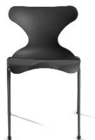
Version 2 sans accoudoirs