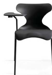
Version avec tablette