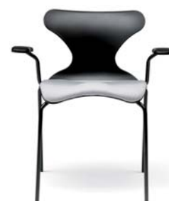
Version 1 avec accoudoirs

Une partie métallique : tige Ø4 chromée et courbe, Et une autre en plastique : Pièce en injection de PA6+30fibre de couleur noire, avec un bouton sur-injecté en rouge.